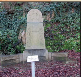
Tombeau d'Anatole Le Braz

Continuez le sentier à mi-hauteur jusqu'au promontoire d'où autrefois l'évêque, ancien propriétaire des lieux, admirait le panorama. Devant vous la passerelle Saint François, ouvrage suspendu construit en 1834 pour remplacer un ancien bac ; il reste à péage jusqu'en 1873, la maison de l'octroi à sa gauche en témoigne, avant d'être supplanté en 1893 par le premier Pont Noir.