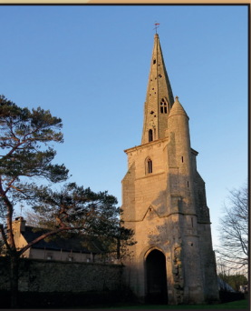
Tour Saint Michel