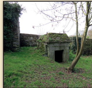
Edicule en pierre