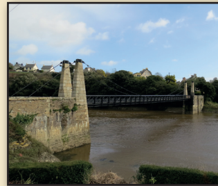
Passerelle sur le GR 34

En longeant le ruisseau, à l'arrière de la station d'épuration, vous rejoignez la rue du Guindy, en face du cimetière. Remontez la rue du Bilo et à gauche contournez le cimetière, traversez la rue des Ajoncs et vous débouchez près des pompiers. Traversez la rue Duc Jean V pour remonter la rue du Phare de la Corne. Après la garderie et avant le Foyer Logement prenez à gauche et traversez le parking.